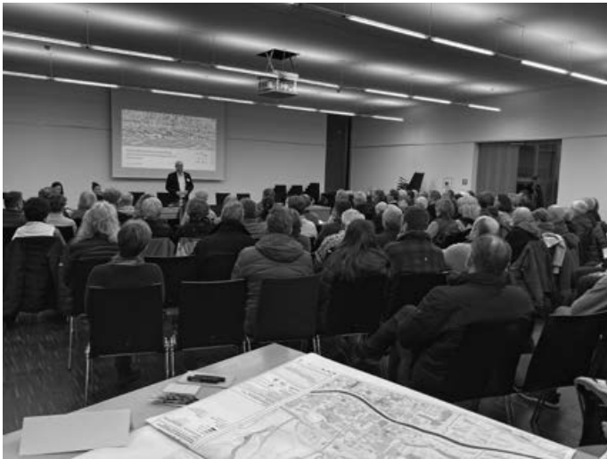
BM Molt im gut gefüllten Sitzungssaal

Am 21.1. fand im Sitzungssaal des Rathauses Remshalden ein Bürgerdialog zum Thema Starkregenrisikomanagement statt. Die Veranstaltung wurde vom Bauamt Remshalden und der Geschäftsstelle Interkommunaler Klimaschutz in Zusammenarbeit mit den Expertinnen und Experten der begleitenden Ingenieurbüros organisiert.