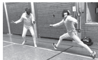
Übungsgefecht mit elekt. Trefferanzeige

Unsere Erwachsenen-Fechtgruppe sucht Damen und Herren, die sich informieren und auch ausprobieren wollen, wie das Fechten funktioniert. Wir bieten eine Einführung in die Theorie, Praxis und Regeln von Florett, Degen und Säbel. Vorkenntnisse sind nicht erforderlich.